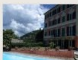
Villa Rosmarino a Portofino