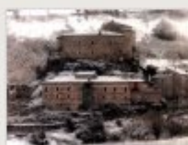
Castel di Luco