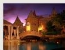
Vacanze in Villa con The Leading Hotels of the World