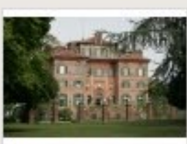
In vendita il Castello di Carla Bruni-Sarkozy