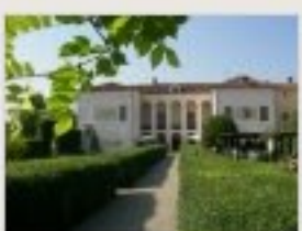
Capodanno con delitto in Villa