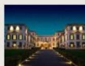
Villa San Carlo Borromeo