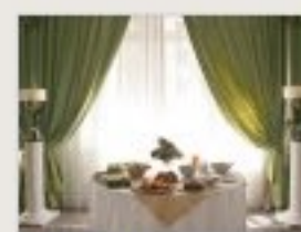
Villa Antea, Firenze