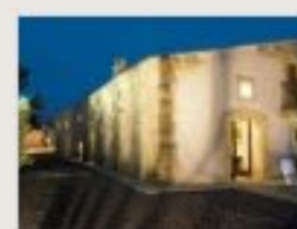
Baglio Villa Sicilia