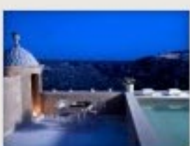
Palazzo Gattini Luxury Hotel