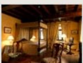
Dormire in un castello da favola