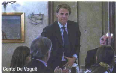
Conte De Vogüé