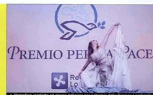
> Abbinata zarifata ed etereo lobos per il Premio della Regione Lombardia