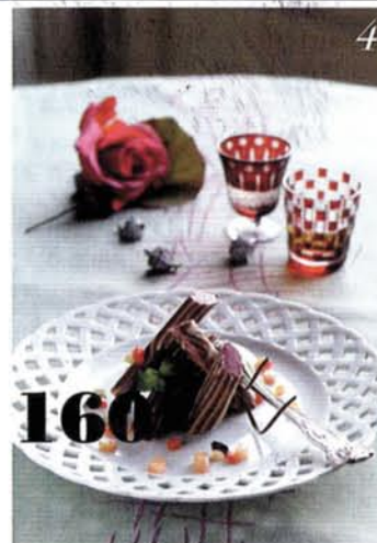
1. IMPONENTE, la facciata nord della villa 2. IL GIARDINO, visto dalla terrazza 3. LA CAMERA DEL PRINCIPE, una suite con opere d'arte 4-5. ALTA QUALITÀ, anche per il food.

È un vero e proprio polo culturale, dove basta attraversare i grandi saloni affrescati per respirare un'atmosfera densa di storia, sulle orme dei grandi personaggi che l'hanno frequentata, da Ippolito Pindemonte a Stendhal e Alessandro Manzoni, solo per citarne alcuni. Ai piani superiori, invece, sono state ricavate le cinquanta camere e suite, tutte con mobili e oggetti d'epoca, affreschi, soffitti a cassettoni e tecnologie all'avanguardia. All'insegna dell'eccellenza anche la cucina, leggera e sofisticata al tempo stesso, da gustare nel ristorante interno The City, valorizzata da una selezione di vini e acque minerali da gourmet. ■